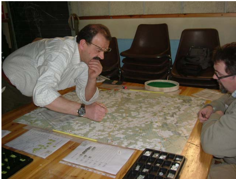
VALCON 2009: Ardennes (The Gamers).